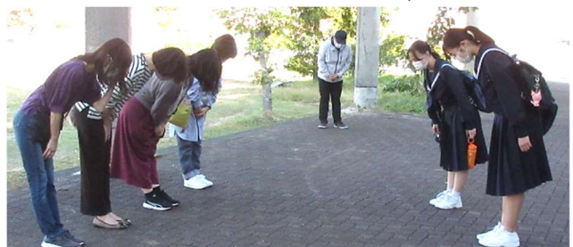
「我が校の宝」 気持ちよい、相手がうれしくなるようなあいさつ